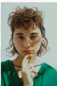
POWERS PHOTO CONTEST 2021 S/S 順グランプリ SCENE by RAD 水口 英里