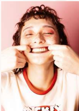
POWERS PHOTO CONTEST 2021 S/S グランプリ SCENE by RAD 竹ノ下 慶弥